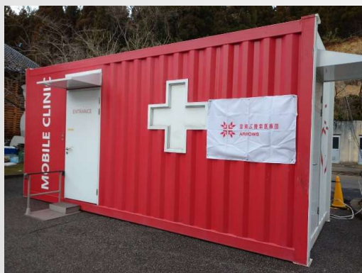
「空飛ぶ捜索医療団が導入した医療コンテナ」