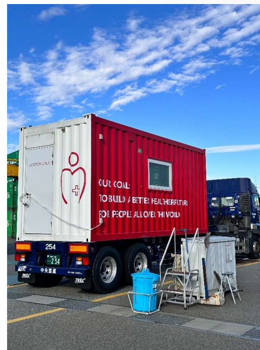
第一陣 2024年1月17日大阪を出発

②は、弊社パートナー企業の医療機器商社様とタイアップし、 高度医療機器・ベッド・椅子などの内装品も提供