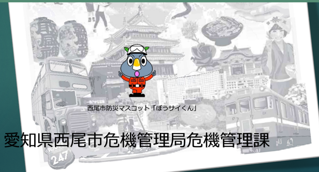
西尾市防災マスコット「ぼうサイくん」